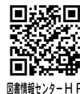
図書情報センターHP