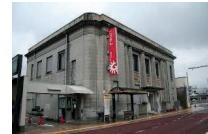
■歴史的建造物の評価

歴史的建造物の歴史的価値を、実測調査を通し明らかにします。文化財に指定・登録されるための調査・評価を行っています。