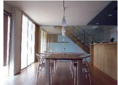
■けやき並木通りの家リノベーション